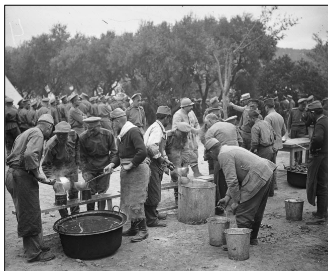
Le repas des soldats russes au camp militaire Mirabeau.

19h30-20h Débat avec le public et lectures de témoignages.